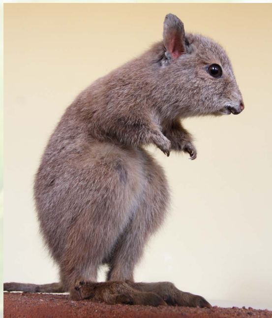
Zottiges Hasenkänguru (vor 1868)

Die Tierwelt des kleinsten Kontinents weist viele Besonderheiten auf. Australien ist die Heimat „Lebender Fossilien“. Die Baupläne dieser Organismen sind im Falle der Lungenfische seit 400 Millionen Jahren überliefert, enge Verwandte von Ameisenigel und Schnabeltier lebten schon